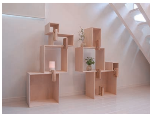
小口を隠して加工した収納ボックス