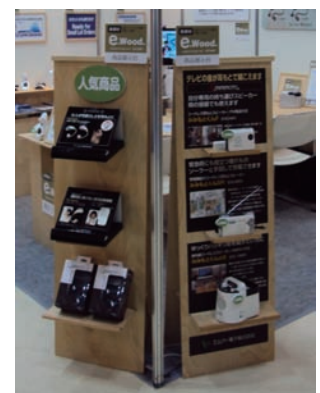
販促用商品展示台