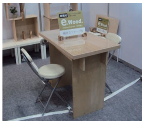
軽くて組み立て簡単なイベントテーブル