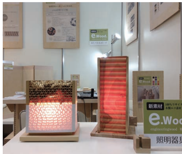
ハニカムボード：照明