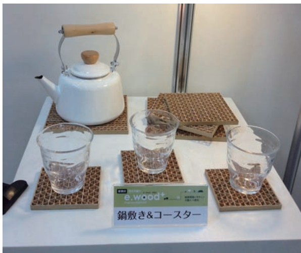
ハニカムボード：鍋敷き・コースター