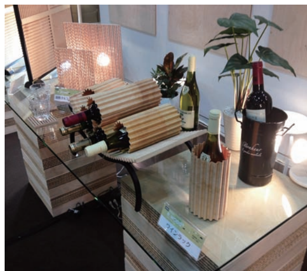
波形ボード：ワインラック